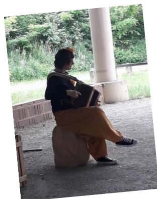
Spectacle pour enfants du 29 mai sous la Halle, organisé par la Médiathèque. Reprise du spectacle vivant pour le plus grand plaisir des petits et des grands !