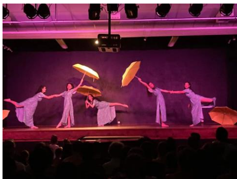
Spectacle de danse au Foyer Rural