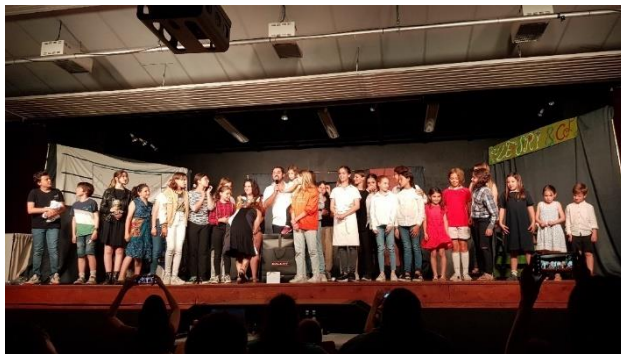
Pièce de théâtre de fin d'année de l'Arbre du Satyre