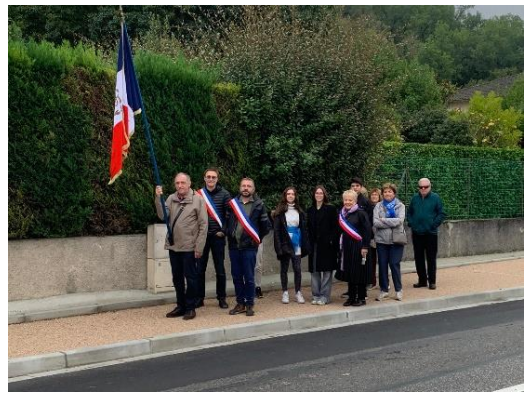
Commémoration du 11 novembre