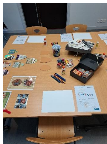
Atelier création de blasons organisé le 13 Novembre à la médiathèque