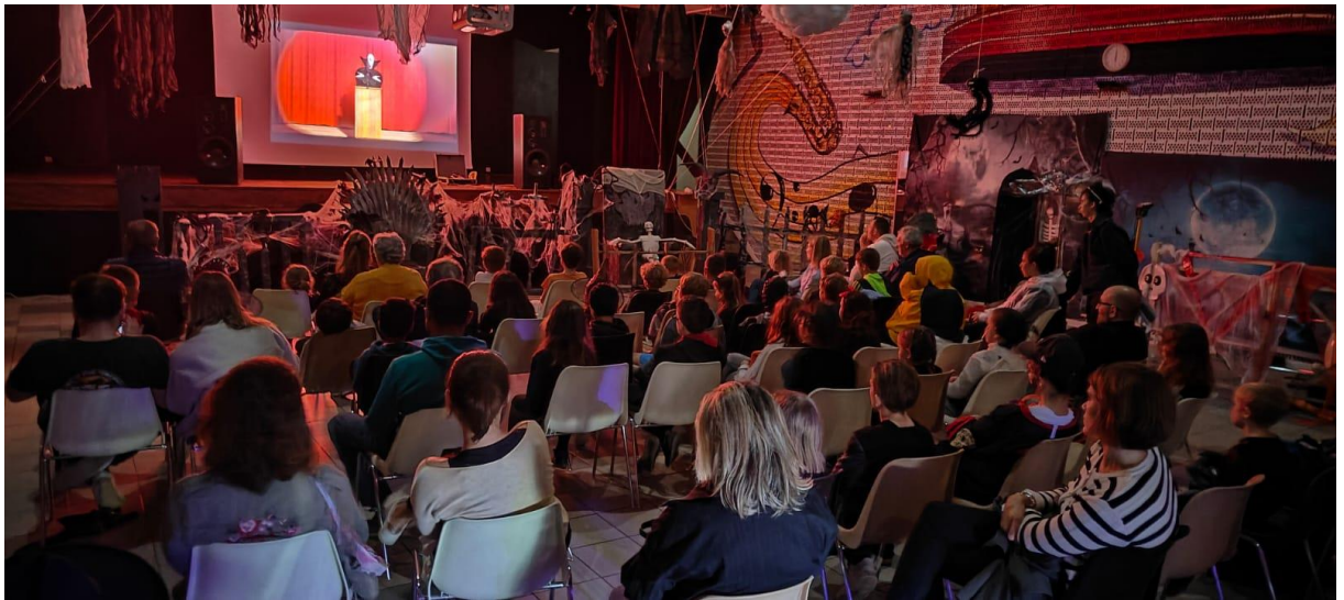
Après-midi Halloween le 31 octobre : toujours un beau succès du Comité des fêtes